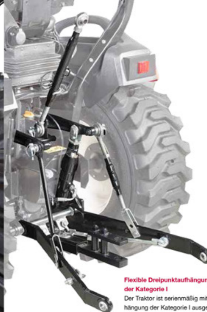
Flexible Dreipunktaufhängung der Kategorie I

Der Traktor ist serienmäßig mit Dreipunktaufhängung der Kategorie I ausgestattet und wird mit einer breiten Palette an Zubehör angeboten, die besonders vielseitige Einsatzmöglichkeiten eröffnet und eine optimale Auslastung verspricht.