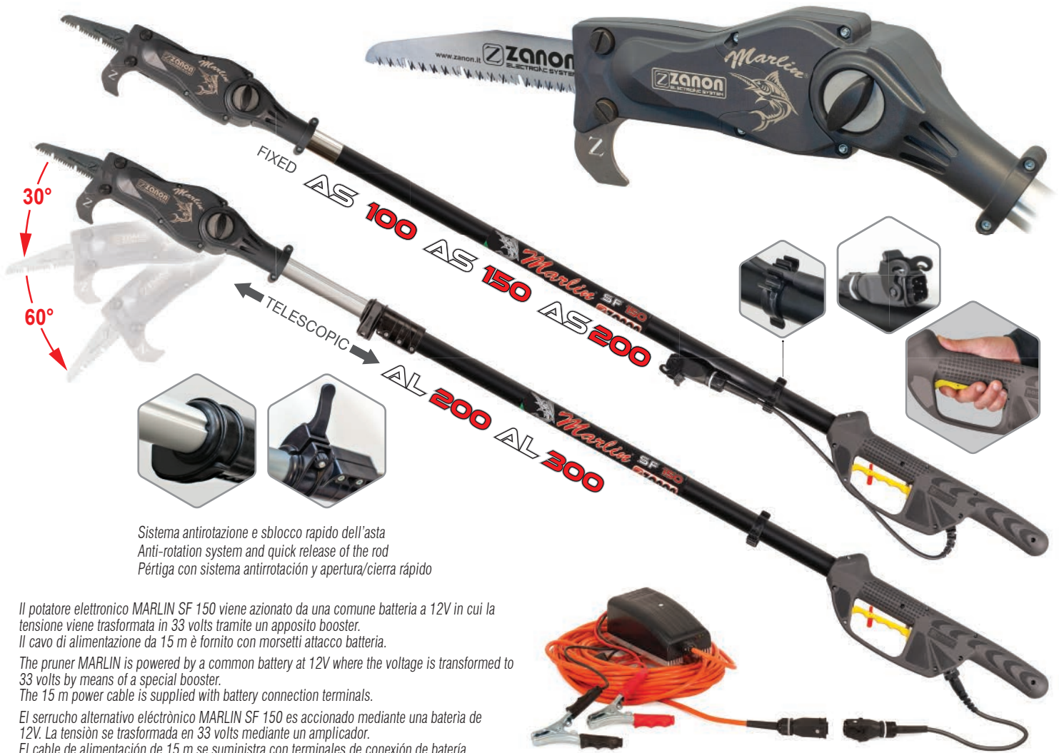
Sistema antirotazione e sblocco rapido dell'asta Anti-rotation system and quick release of the rod Pértiga con sistema antirrotación y apertura/cierra rápido

Potatore MARLIN SF 150 su asta (*centralina elettronica 33V NON INCLUSA) Pruner MARLIN SF 150 on rod (* 33V electronic control unit NOT INCLUDED) Podador MARLIN SF 150 en pértiga (* Unidad de control electrónico 33V NO INCLUIDA)