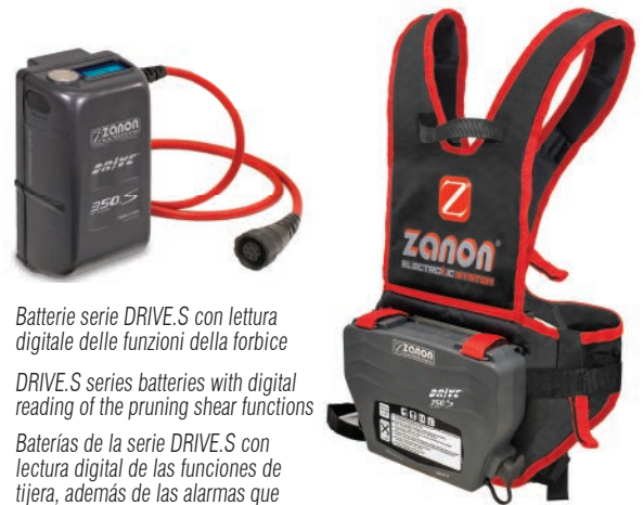
Batterie serie DRIVE.S con lettura digitale delle funzioni della forbice