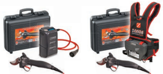
Kit DRIVE 350.S