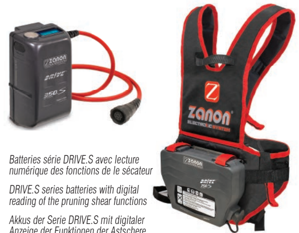
Batteries série DRIVE.S avec lecture numérique des fonctions de le sécateur